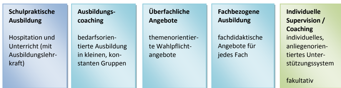
Abbildung 1: Ausbildungsbestandteile im Vorbereitungsdienst