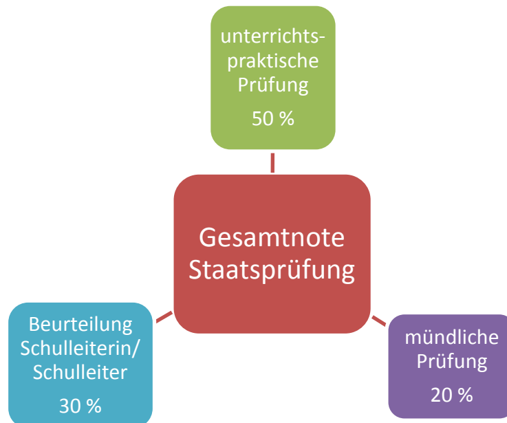
Abbildung 3: Beurteilung und Bewertung der LAK im Vorbereitungsdienst

Die Beurteilung und Bewertung der LAK ist in der „Ordnung für den Vorbereitungsdienst und die Staatsprüfung für ein Lehramt im Land Brandenburg“ (Ordnung für den Vorbereitungsdienst – OVP, gültig ab 01.01.2019) geregelt. Die Note der Staatsprüfung setzt sich folgendermaßen zusammen: